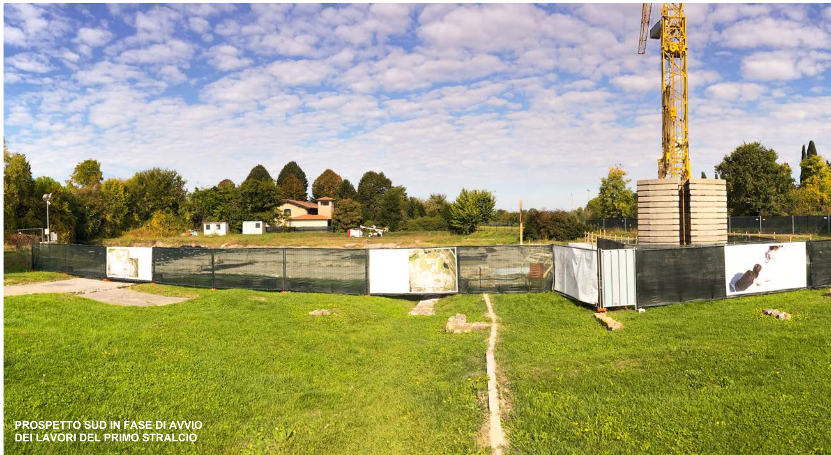
PROSPETTO SUD IN FASE DI AVVIO DEI LAVORI DEL PRIMO STRALCIO