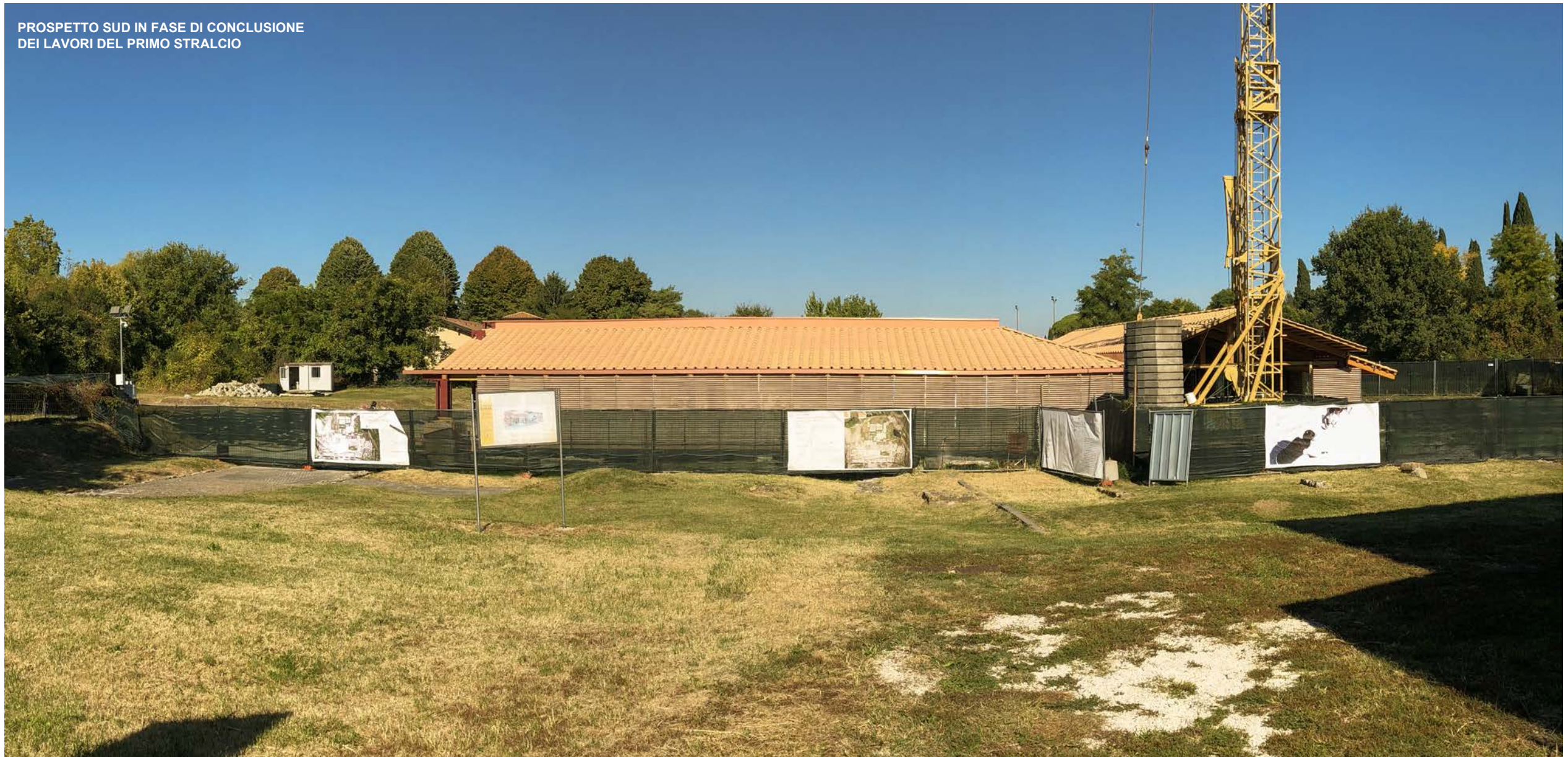
PROSPETTO SUD IN FASE DI CONCLUSIONE DEI LAVORI DEL PRIMO STRALCIO