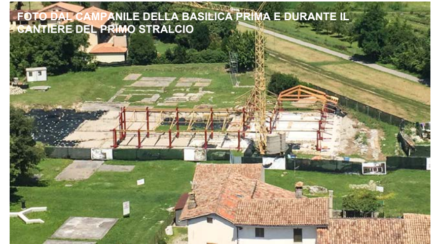
FOTO DAL CAMPANILE DELLA BASILICA PRIMA E DURANTE IL GANTIERE DEL PRIMO STRALCIO