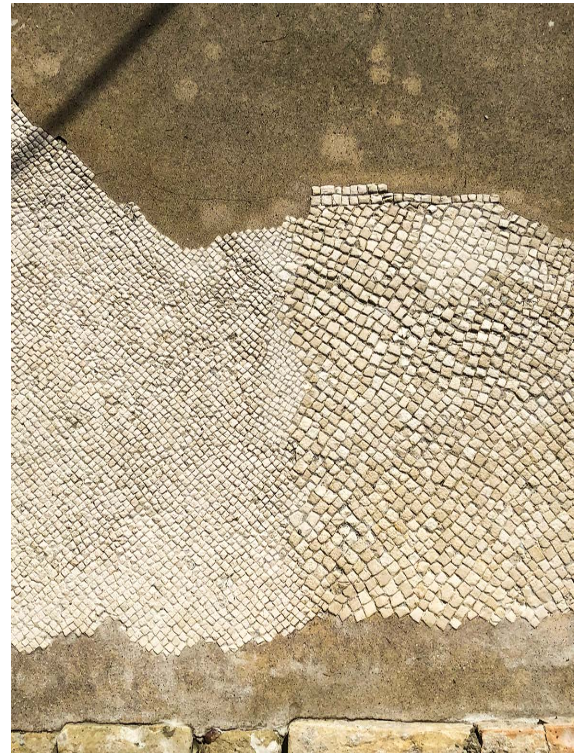
PARTICOLARE INTERVENTO MOSAICI